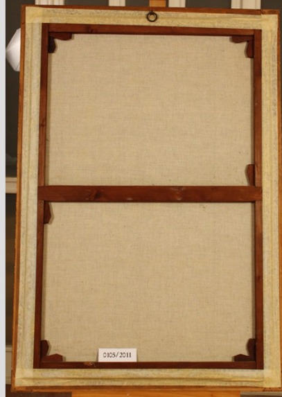
3. Ismeretlen velencei festő, 18. század közepe: Capriccio I. és Capriccio II., (Olaj, vászon, 104,5x70 cm, Jelzés nélkül, KÖH műtárgykviteli szemlesorszáma: 0105/2011-0106/2011)