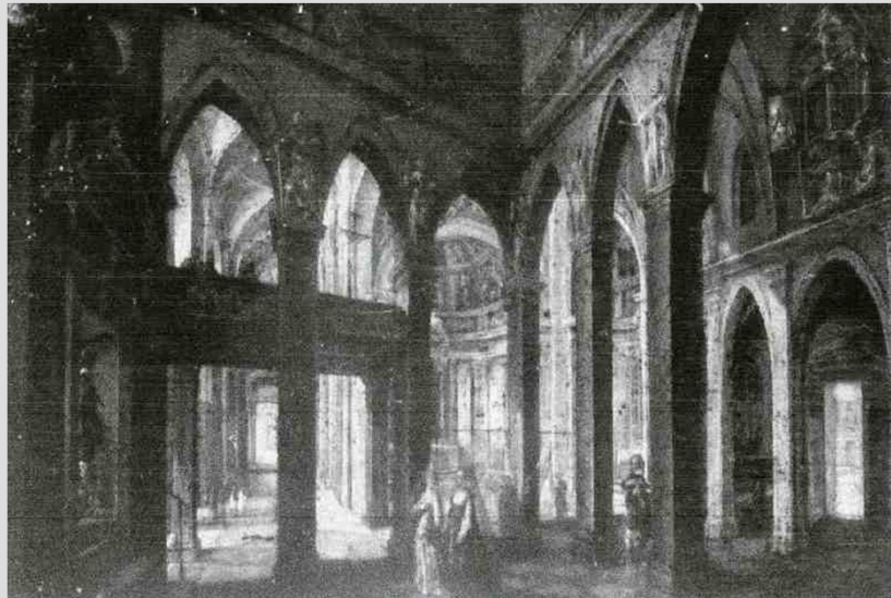
4. Ismeretlen németalföldi festő, 17. század első fele: Templombelső KIB / 2011.03.31. (Olaj, fa, 20 cm x 30 cm, védési szám: Szépművészeti Múzeum: 1/95, KÖH műtárgy-nyilvántartási azonosító: 79736, törzsanyag)