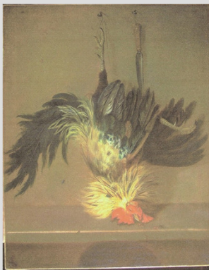
Valkenburg, Dirk köre (?): Trompe l'oeil leölt kakassal (magángyűjtemény, Magyarország, VÉDETT / KÖH mt.az.: 68393)