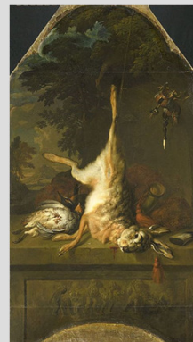
Valkenburg, Dirk: Csendélet leölt nyúllal és fogollyal (Rijksmuseum, Amsterdam)