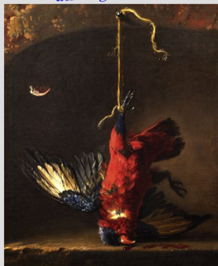
Valkenburg, Dirk: Csendélet leölt vaddal (magángyűjtemény, USA)