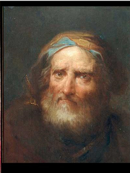
Idős férfi portréja (Ca' Rezzonico, Velece)