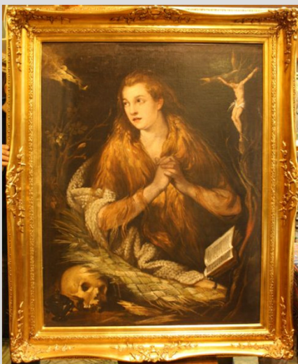
2. Tintoretto, Domenico (Velece, 1560 – Velece, 1635): Bűnbánó Magdolna (Olaj, vászon, 118x93 cm, jelzés nélkül)