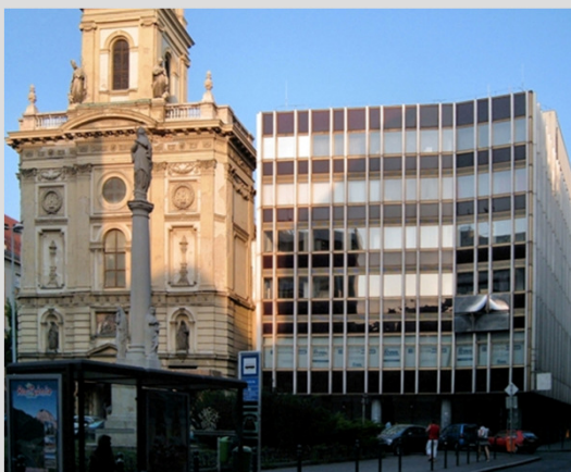
2. Csiky Tibor (Olaszliszka, 1932 – Budapest, 1989): Dombormű, 1975-76 (krómacél, 231x383 cm, őrzési helye: egykori Belvárosi Távbeszélő központ Szervita térre néző homlokzata – 1052 Budapest, Petőfi Sándor u. 17.)