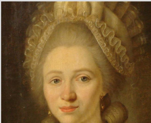
7. Francia festő, 1793-ból: Női képmás (olaj, vászon, 50 cm x 35 cm, hátoldalon felirat: Allin pinxit 1793, védési száma: Műv. Min.: 84710/96, KÖH műtárgy-nyilvántartási azonosító: 79595, törzsanyag)